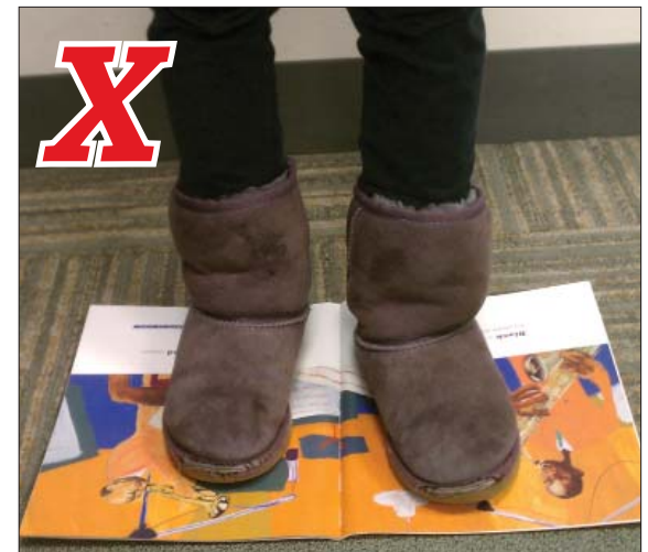
Standing hurts the spine. Pararse sobre el libro daña las páginas y el lomo.