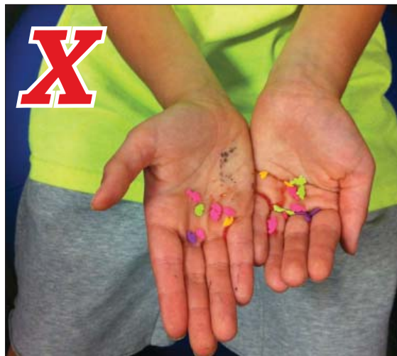
Dirty hands hurt the pages. Las manos sucias dañan las páginas.