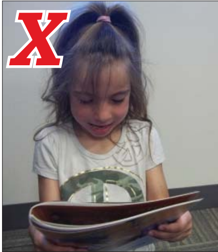
Folding hurts the spine. Doblar la cubierta hacia atrás daña el lomo del libro.

Careful handling can help your books last for years. • Sea cuidadoso, los libros pueden durar muchos años.