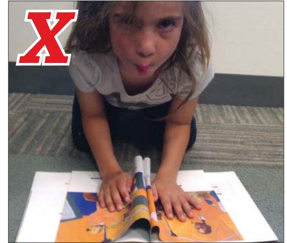
Squishing hurts the pages. Apretar el libro daña las páginas.