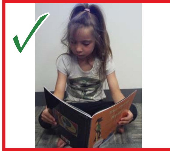
A perfect hold! ¡Uso perfecto!